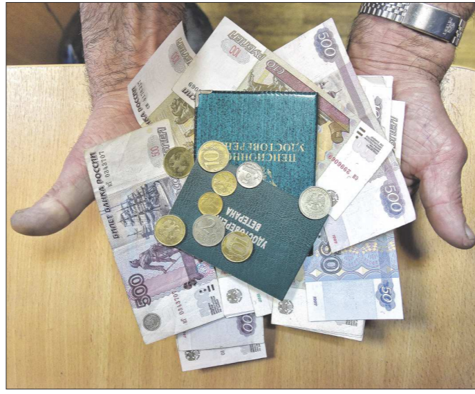
В некоторых случаях благодаря суду и обудсмену пожилым людям удалось увеличить сумму пенсий на несколько тысяч рублей

— На тот момент было уже и решение Верховного суда России по аналогичному делу, так что мы были уверены в правоте. В регионе немало людей, приехавших из бывших советских республик, они сталки-