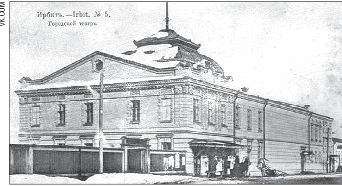
Так выглядело здание Ирбитского театра в конце XIX века

Глядя на сцену, невольно вспоминаешь знаменитый эпизод из «Правдивых миллионов» Мамнина-Сибиряка, где на сцене Ирбитского театра застрелили актрису. Не здесь ли снимался одноимённый фильм Ярополка Лапшина, где сцена эта присутствует? – Нет, фильм точно снимали не у нас, – говорит Светла-