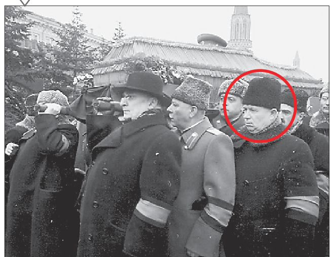
Хрущёв (в кружке) хоронил Сталина дважды: в 1953 году — в буквальном смысле, а в 1956-м — в переносном