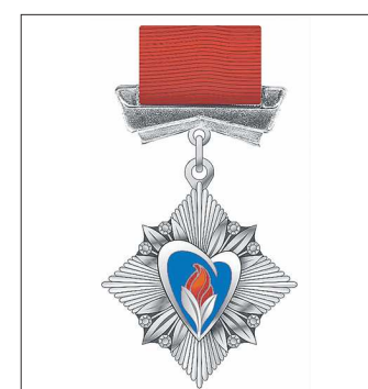
Нагрудный знак «Горячее сердце»