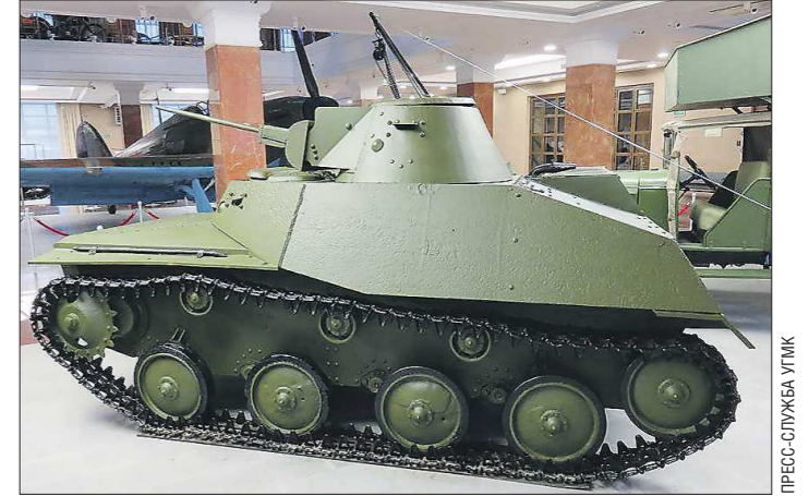
Лёгкие танки Т-30 были интересной разработкой, но для танковых сражений, конечно же, не годились