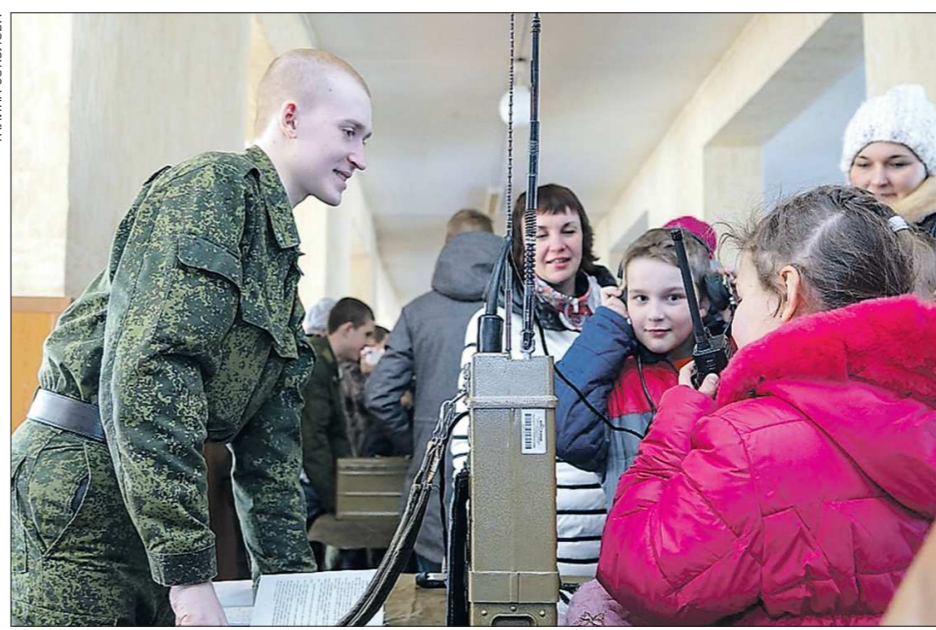
У ракетчиков регулярно проходят слёты солдатских матерей, и им показывают, в каких условиях служат их сыновья. Приезжают провести служивых и их сёстры