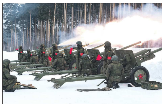
Во время залпа главное — синхронность