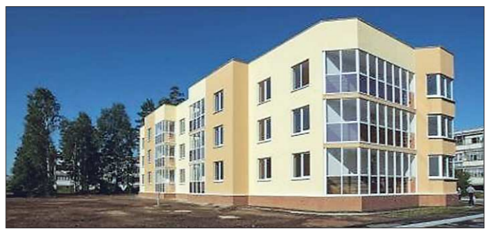
Дом-победитель был сдан в эксплуатацию в декабре 2013 года

Министерство строительства и ЖКХ РФ подвело итоги всероссийского градостроительного конкурса. В номинации «Лучший реализованный проект энергосбережения при строительстве жилья экономкласса» первое место занял трёхэтажный многоквартирный дом, построенный в Рефтинском ГО.