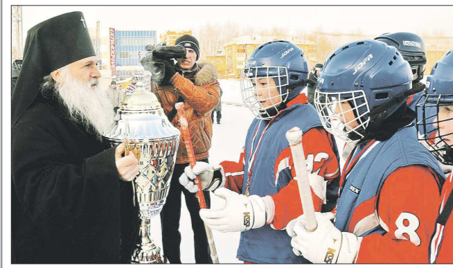
Главный приз — Кубок Патриарха — ребята получили из рук представителя РПЦ — тогдашнего архиепископа Екатеринбургского и Верхотурского Викентия

По субботам, как всегда, в «ОГ» — красная БУРДА