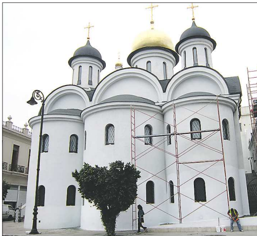
Храм в Гаване — единственный православный храм на Кубе. Завтра патриарх Кирилл отслужит там литургию

— Это, безусловно, историческое событие, но оно носит чисто политическое и дипломатическое значение, посвящено только одной проблеме — геноциду христиан на Ближнем Востоке и Северной Африке, — отметил про-