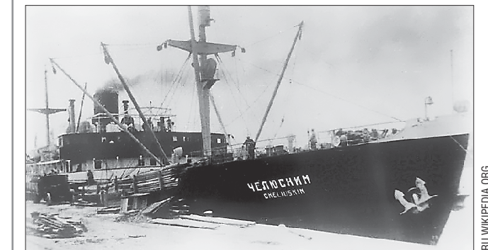
Знаменитое судно построили в 1933 году в Дании и назвали в честь русского полярного мореплавателя Семёна Челюскина (1700-1764)