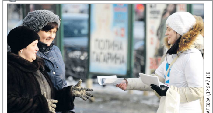
Вчера в Екатеринбурге прошла акция, приуроченная к дню рождения дважды Героя Советского Союза лётчика Григория Речкалова.

Конкурсный управляющий Опышко В.А. сообщает о реализации посредством публичного предложения имущества ООО «УТК МАРТ» (620072, г. Екатеринбург, ул. Высоцкого, 10-468, ИНН 6670041148, ОГРН 1036603540643, Решение АС Свердловской области № А60-18054/2011 от 10.07.2013 г.) на сайте ОАО «Российский аукционный дом» (оператор ЭТП), в сети Интернет: http://www.lot-online.ru, лот № 1: встроенное помещение (литер А), номера на поэтажном плане: цокольный этаж — помещения №№ 33-69, 74 (в части жилого дома кв. 1-99) общей площадью 893,4 кв. м, расположенное по адресу: г. Екатеринбург, ул. Мамина-Сибиряка, 132, нач. цена — 70 897 434,61 руб.