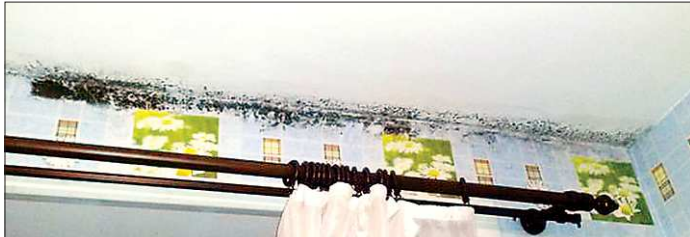
По мнению жильцов, плесень не уходит из-за холодных стен и неработающих вентиляций

Уже в 18-й программной новостройке Свердловской области появляется плесень. На этот раз проблему обнаружили верхотурские дети-сироты, которые заехали в новый дом по Заводской, 7 прошлой зимой.