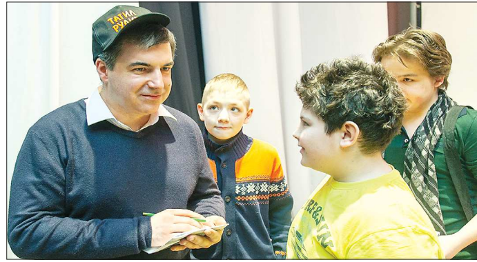
Из Нижнего Тагила Костя уехал в бейсболке с надписью «Тагил рулит!» и с расплывшим подносом. На прощание всем желающим раздал автографы, а молодым учёным пообещал прочитать их статьи и дать отзывы

На встречу выпускников нижегородского лицея №39 приехал профессор Манчестерского университета, лауреат Нобелевской премии по физике Константин Новосёлов.