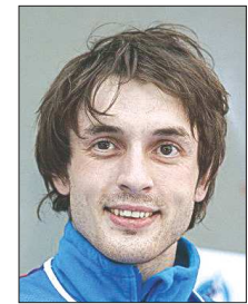
Дмитрий Шарафутдинов – единственный трёхкратный чемпион мира по скалолазанию из России