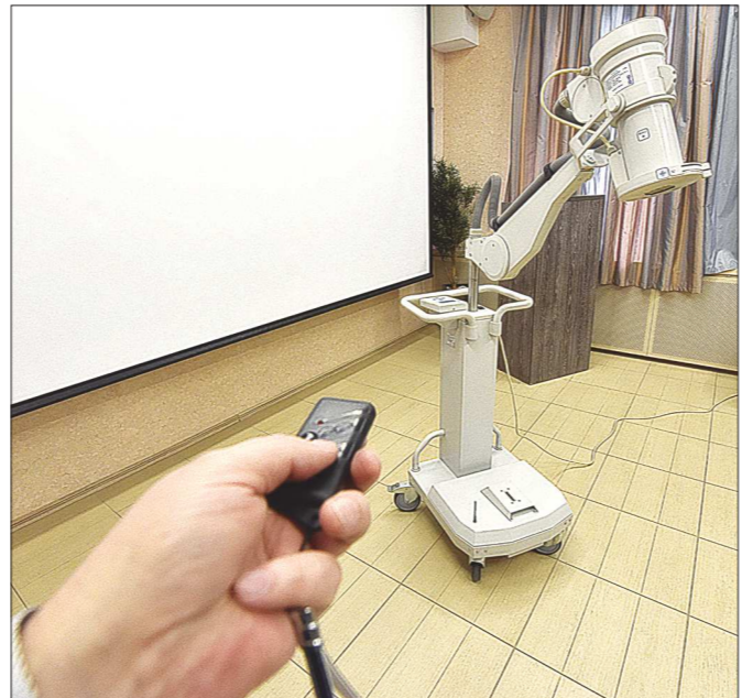
Теперь сделать рентгеновский снимок можно прямо в палате благодаря мобильному рентгеновскому аппарату, который создали учёные из Института электрофизики УрО РАН. Устройство работает на небольшом импульсном генераторе, что позволяет снизить дозу облучения, сохранив при этом качество снимка. Сегодня такие аппараты уже есть в госпитале ветеранов войн в Екатеринбурге, а также в различных медицинских учреждениях в Астрахани, Казани и Санкт-Петербурге

Губернатор Свердловской области Евгений КУЙВАШЕВ