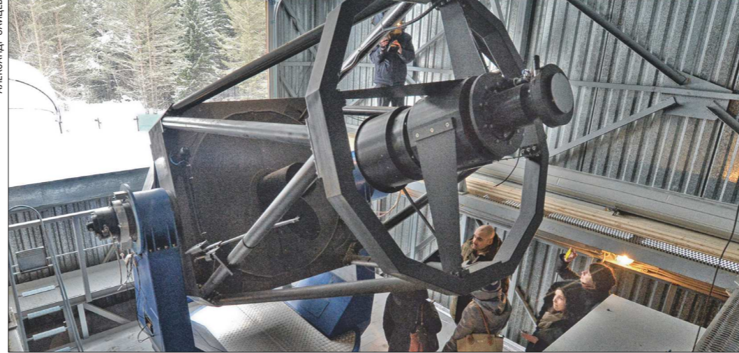
Научные исследования проводятся не только в институтах УрО РАН, но и в университетах. На фото – звёздный телескоп диаметром 1,2 метра, который установлен в Ковровской астрономической обсерватории УрФУ в 2009 году. Телескоп позволяет получить самые разные данные о звезде: узнать её температуру, массу, возраст, характеристики магнитного поля и силу тяжести на поверхности. Недавно в обсерватории появился новый телескоп, о нём читайте подробнее в ближайших «Новостях науки»