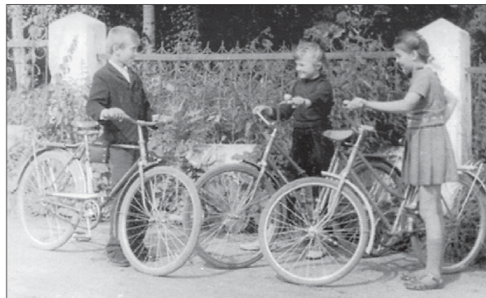
«Уралец» (на фото — слева) и «Рябинка» — это как брат и сестра. Первый предназначался для мальчиков и имел горизонтальную (закрытую) раму. «Рябинка» была девчачьим велосипедом с наклонной (открытой) рамой

В Советском Союзе велосипеды для подростков выпускали также на Шауляйском велосипедно-моторном заводе (литовское предприятие собирало их под марками «Эрелкокс» — «Орлёнок» — и «Крежгуте» — «Ласчочка»). Но когда был выбор, люди отдавали предпочтение именно атигским велосипедам: дело в том, что уральцы внедряли на своём производстве конденсаторную сварку рамы, что серьёзно увеличило прочность конструкции. Также уральские велосипеды отличались лёгкостью хода и устойчивостью. Поэтому продукция АМЗ пользовалась в СССР