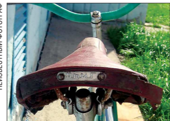
На заводе в Атиге производили не все детали велосипеда. Например, втулка переднего колеса поставлялась с Жуковского велосипедного завода, втулка заднего — из Харькова, педали — из Даугавпилса, а седла — из Нижнего Тагила (их изготавливали в одном из исправительных учреждений)

вод начал выпуск своих самых популярных моделей — «Уральца» (для мальчиков) и «Рябинки» (для девочек). Чуть позднее появился совершенно невероятный по тем временам велосипед «Весна», который... складывался пополам (и в таком виде спокойно влезал в багажник любой легковушки).