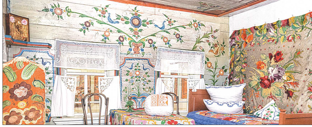
Кроме стен расписывали и другие предметы – например, мужчину обязательно делали невесте, а потом и дочке расписную прялку, это было что-то вроде открытки с пожеланием. Уникальный же вариант создавался на стенах. Семьи победнее заказывали себе только ставни или двери, кто побогаче – целую горницу. Перед нами горница из музея Нижней Синячихи