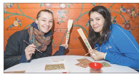
Популярной формой досуга остаются мастер-классы по росписи – один из таких редакция «ОГ» посетила в Нижней Синячихе, что, согласно северной легенде, является волшебной чашей жизни. Человек смотрел на свою большую родословную, куда дорисовывали и сестёр с братьями, и дядей с тётьками, и он знал, что хорошо защищён своей семьёй.