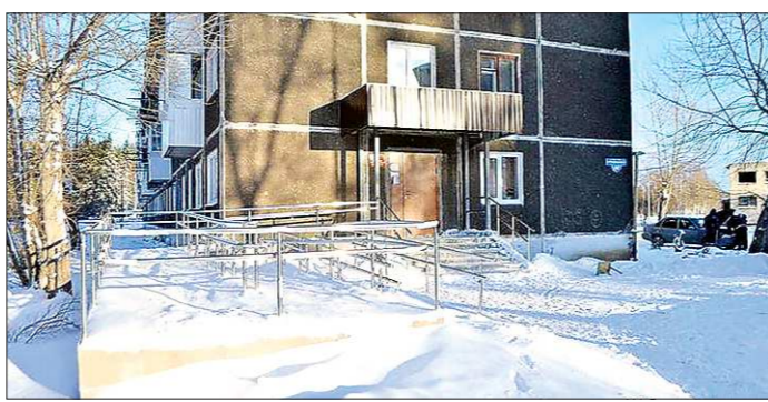
Администрация нижнетагильского посёлка Покровское-1. Так выглядит пандус зимой — весь в снегу

В Нижнем Тагиле начнётся проверка объектов инфраструктуры, чтобы выяснить, насколько они доступны для маломобильных граждан. Чиновники намерены наведаться по 179 адресам: в школы, садики, магазины, учреждения культуры и спорта, отделения связи и банки. Опережая комиссию, «ОГ» отправилась в собственный рейд по тагильским учреждениям и выяснила, куда может попасть инвалид.