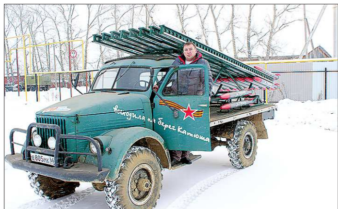
Владимир думал и на Новый год устроить огненную канонаду, да решил не шиковать, ведь на один залп нужно потратить порядка пяти тысяч рублей