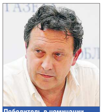
Победитель в номинации «Полъза дела» за международный фестиваль фантастики «Азлита» (председатель оргкомитета и главный организатор фестиваля фантастики «Азлита»)