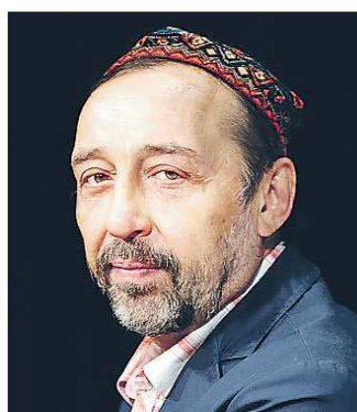
Победитель в номинации «Мастер. Проза» за собрание избранных сочинений