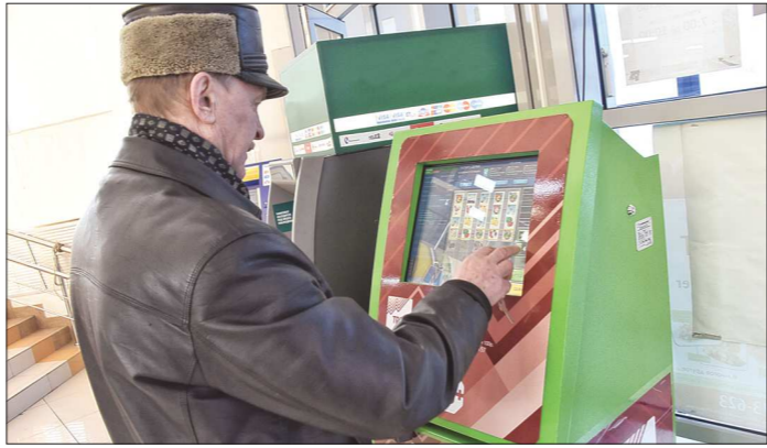
По словам владельцев терминалов, вишенки и обезьянки на экране – это лишь красивое оформление процесса игры на валютной бирже

Терминал стоит около 120–130 тысяч рублей. Подключить программное обеспечение для «Trade box» продавцы обещают бесплатно, но просят вернуть 90 процентов от прибыли (всех денег, опущенных в терминал). Предпринимателю остаётся лишь 10 процентов, но этого хватает, чтобы окупить бизнес – покупку, обслуживание терминала и аренду места. Звоню в одну из подобных