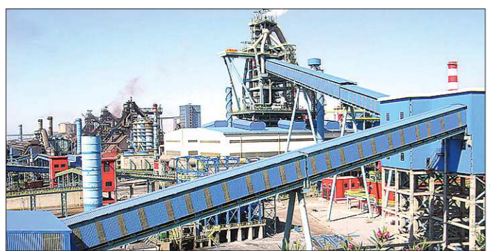
Так выглядит завод сегодня. Три домы, дымящие на заднем плане, построили с помощью тагильчан