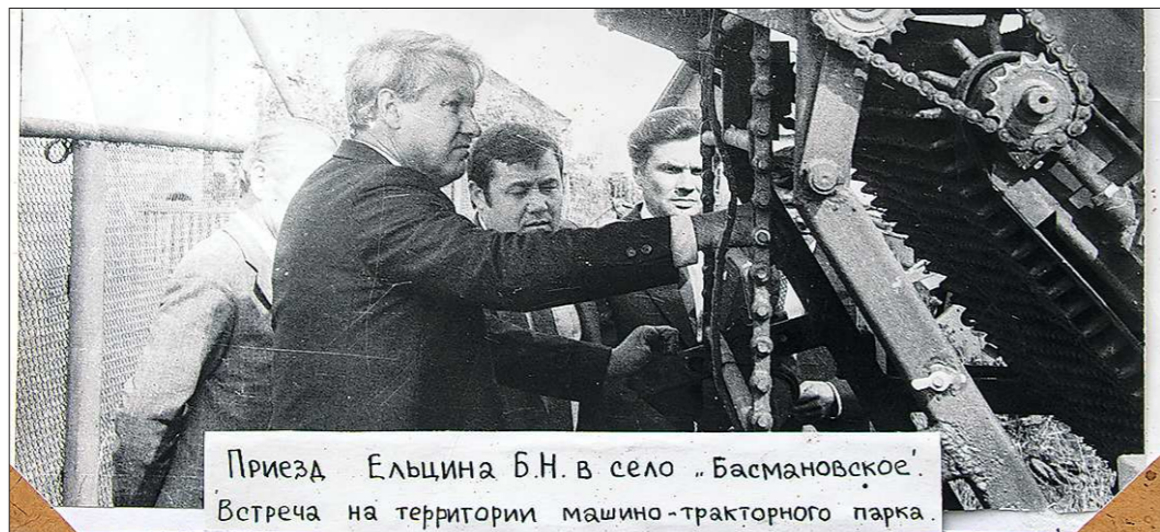
Приезд Ельцина Б.Н. в село «Басмановское». Встреча на территории машино-тракторного парка.

«Я родился 1 февраля 1931 года в селе Бутка Талицкого района Свердловской области, где жили почти все мои предки», — написал в 1990 году в своих мемуарах «Исповедь на заданную тему» Борис Ельцин.