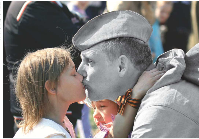
8 мая 2011 года. Рассказывает автор — Александр Зайцев: «Кадр сделан в преддверии Дня Победы. На снимке — организатор военно-исторической реконструкции. Когда к нему подошла дочка, я успел сделать этот кадр. После начал отсматривать материал и увидел, что фото яркое, эмоциональное, но не более. Тогда решил обесцветить часть фотографии, получилось интересно и даже трогательно, будто встретились два человека из разных эпох...»

тельный. А ещё нужно быть открытым к тому, что ты делаешь. Если подойдёшь к человеку с мрачным видом, то