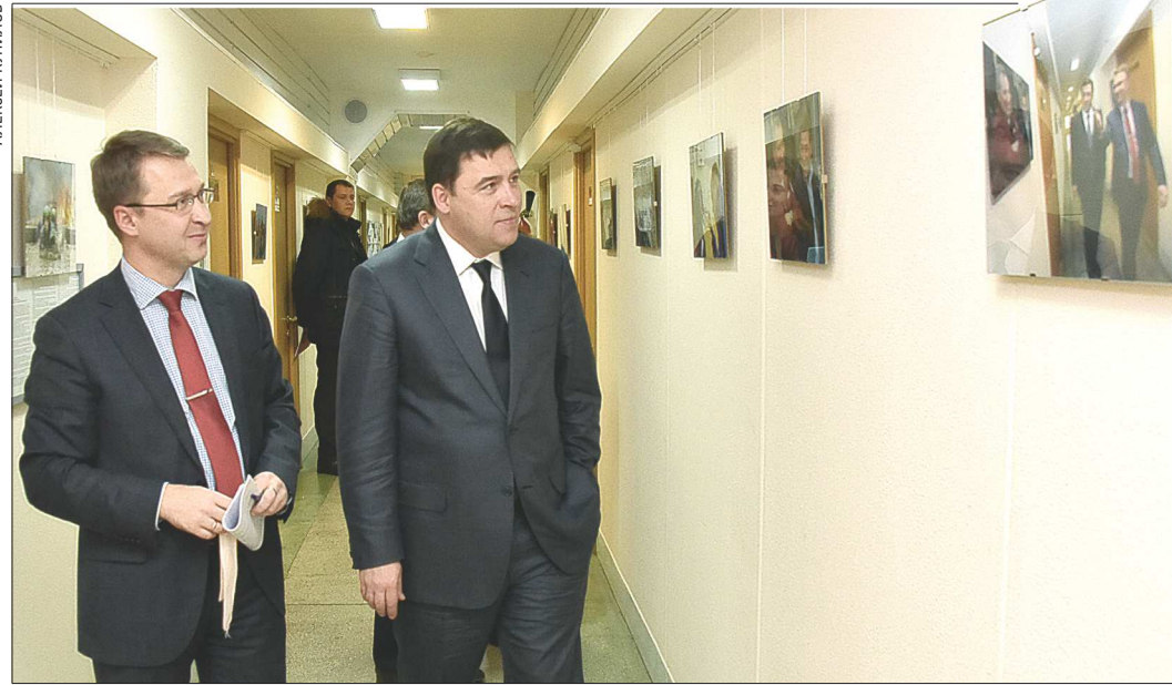
В экспозицию вошёл кадр, который был сделан во время предыдущего визита в «ОГ» Евгения Куйвашева. Тогда губернатор Свердловской области высоко оценил работы наших фотографов, поэтому с удовольствием принял предложение открыть обновлённую выставку