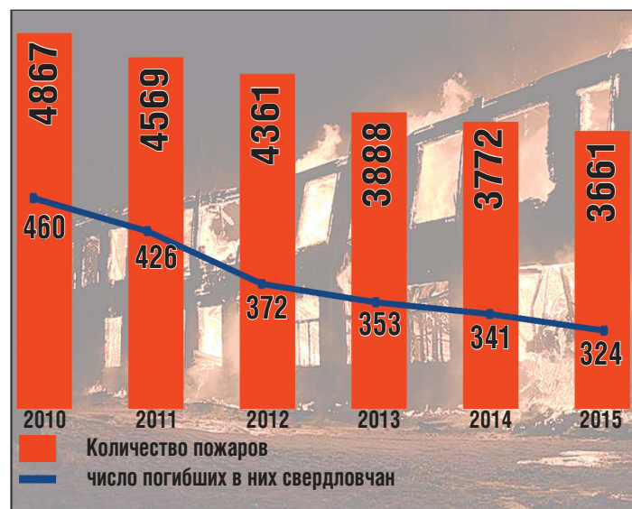
С появлением новых депо число жертв пожаров стабильно уменьшается

В 2011 году в рамках программы было решено построить за пять лет 23 объекта: на эти цели предполагалось выделить более миллиарда рублей. Через два года была принята новая программа — Концепция развития противопожарной службы, в которой первоначальные планы откорректировали. В ряде малочисленных населенных пунктов ограничили создание добровольных пожарных дружин с серьезной технической оснасткой. Так произошло, например, в поселке Лебяжье Каменского района, где на помощь жителям пяти улиц и клиентам Центра социальной адаптации в случае пожара готовы прийти добровольцы, в распоря-