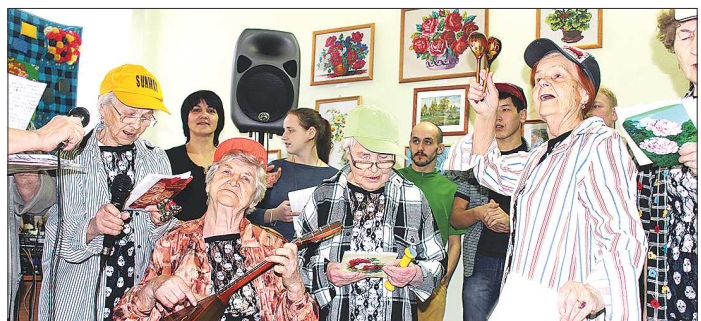
Свое название «Привокзальные Дунаши» коллектив взял от микрорайона Привокзальный, где живут его участницы