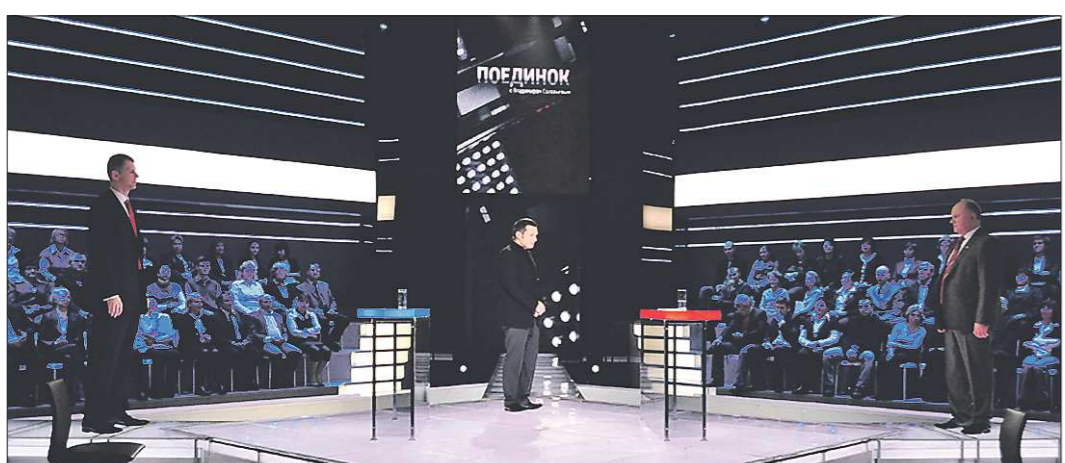
Технические возможности по организации предвыборных телешоу есть далеко не во всех муниципальных образованиях