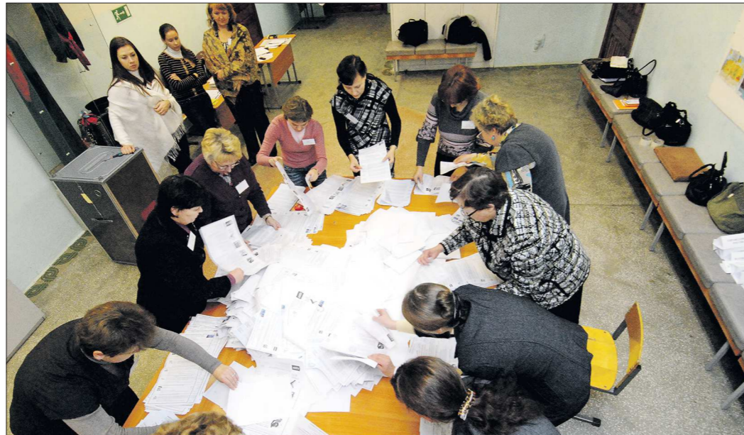
В России официально зарегистрировано 77 политических партий, однако избираться в Госдуму без сбора подписей избирателей имеют право только 14 из них

По словам Мошкарёва, так как их партия ещё не набрала необходимый политический