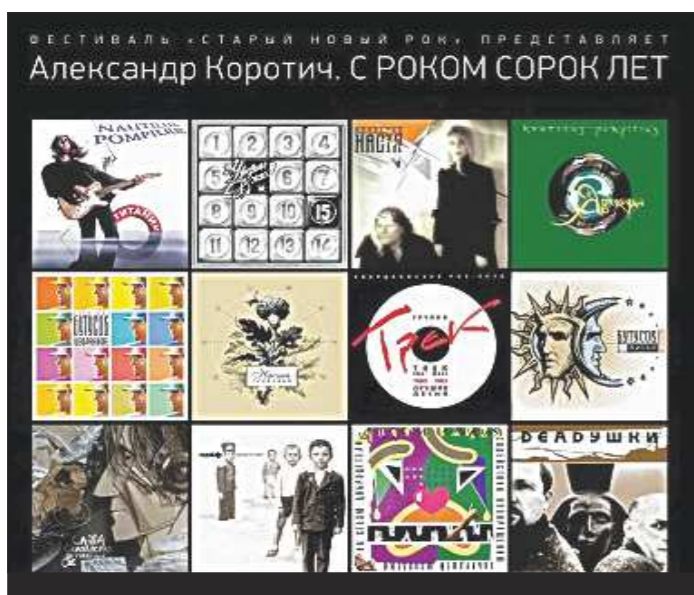
Формат у книги очень необычный – ровно 300 на 300 мм. Это стандартный размер обложки виниловой пластинки