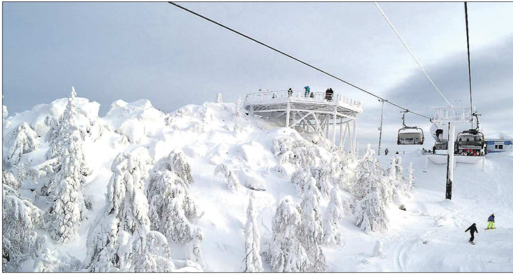
Центр «Гора Белая» этой зимой очень популярен. Он привлекает туристов наличием пяти горнолыжных трасс и спортивного комплекса с полноценным сервисом: бассейн, залы для занятий футболом и волейболом, тренажёрный зал, ледовый каток

Туризм в нашем регионе имеет несколько ключевых направлений. Например, для сторонников активного отдыха в