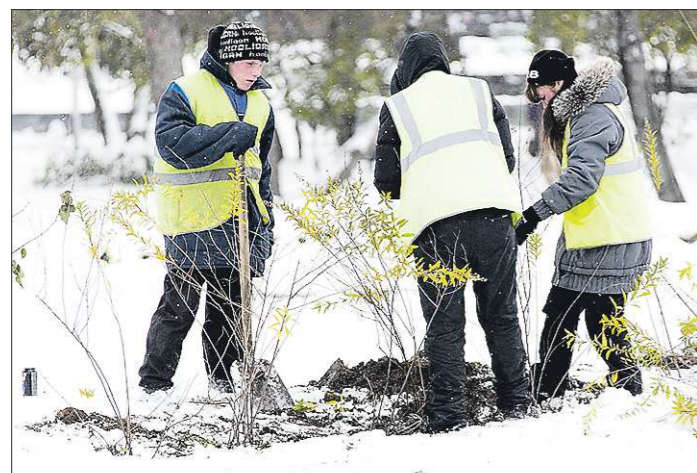
Прошлой осенью тагильчан озадачили рабочие, высадившие кусты у театра кукол