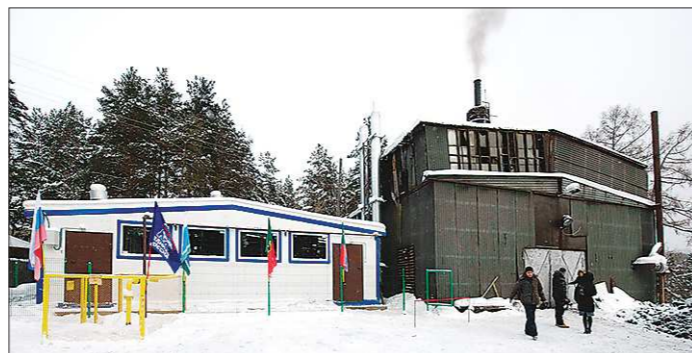
Новая котельная вывела Первоуральск на финишную прямую по газификации территории

Несколько лет назад жители Прогресса обратились в администрацию Президента России с просьбой о помощи: необходимо было восстановить работу закрытого детского сада и обеспечить населённый пункт экономичным топливом — в первую очередь для сада, сообщили в пресс-службе администрации городского округа. После этого администрация Первоуральска вплотную взялась за комплексное решение насущного вопроса. Чтобы новая котельная смогла дать тепло потребителям, пришлось провести в