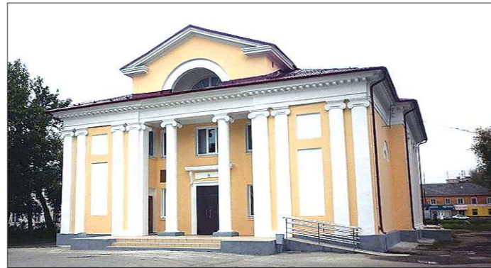
Буланашский кинозал на 240 мест открыт с 1951 года. На полученные деньги здесь заменят кинооборудование: из-за устаревшей техники новые фильмы смотреть нельзя