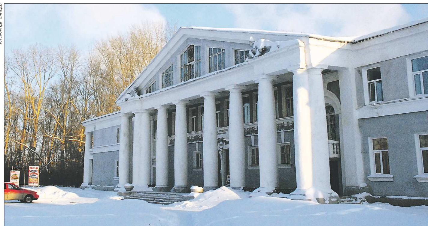
В этом богдановичском Дворце культуры будет оборудован кинозал