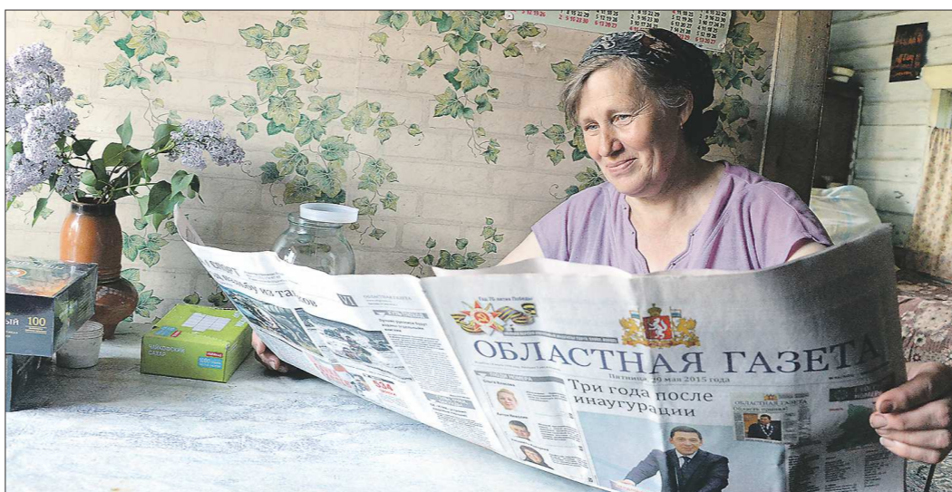
«Областную» читают не только в крупных городах Свердловской области, но и в самых небольших населённых пунктах, например, в посёлке с символическим названием Газета