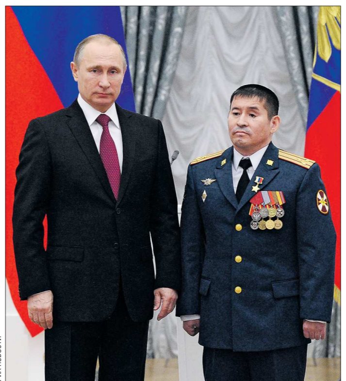
Владимир Путин вручил Серку Султангабиеву звезду Героя России

ду, да ещё из рук Верховного главнокомандующего — большая честь. В тот момент я чувствовал огромную гордость.