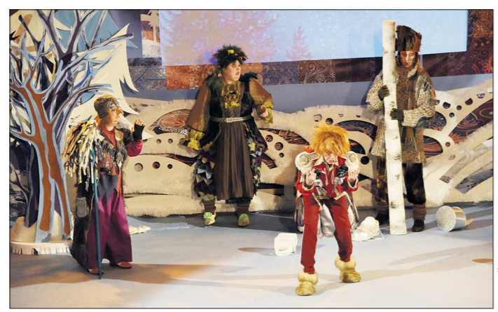
Помимо новогоднего подарка гостей губернаторской ёлки ждёт театрализованное представление

В этом году гостями ёлки, помимо свердловчан, станут дети военнослужащих авиабазы Кант (Киргизия) и подшефных экипажей ракетных подводных крейсеров стратегического назначения «Екатеринбург» и «Верхотурье». Также в праздновании примут участие дети тех, чьи родители вынужденно покинули Украину.