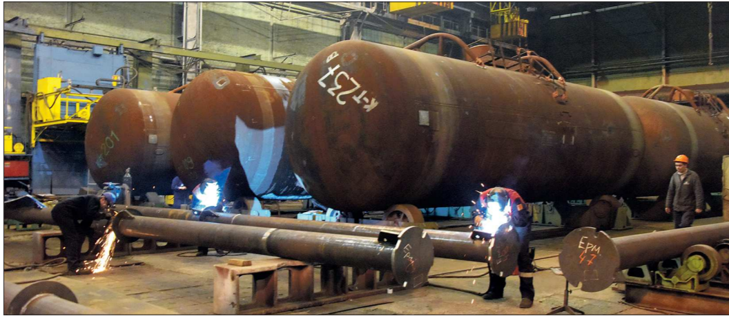
На Уралхиммаше надеются, что котлы цистерн скоро снова станут востребованной продукцией

— Есть ли вопросы, которые требуют повышенного внимания? Что вы предпринимаете для их разрешения? — Основная задача сейчас — выполнение планов по контрактам, чтобы полностью обеспечить на 2016 год загрузку производства. Кроме того, мы сделали акцент на заключение высокоарбитражных контрактов (то есть при выполнении которых достигается