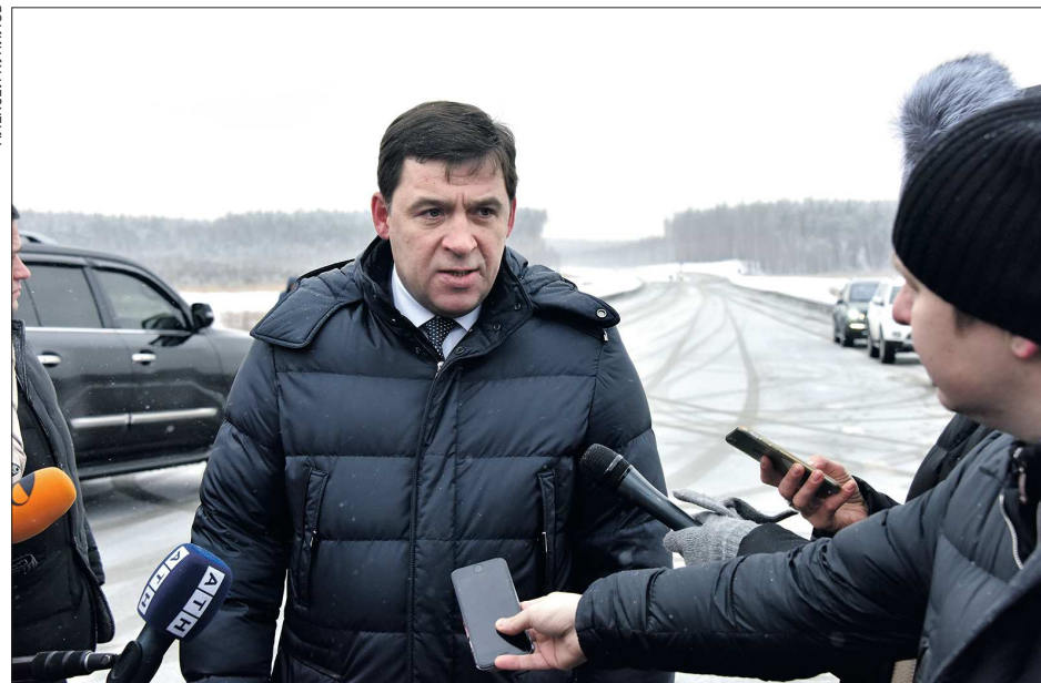
На вопрос журналистов о возможном введении платы за проезд по новому отрезку кольцевой автодороги Евгений Куйвашев сказал, что речи о платности проезда сейчас не идёт

При строительстве дороги были применены самые современные технологии, использовались ответственные материалы, производились масштабные работы. Генеральным подрядчиком работ выступило ОАО «Трест Уралтрансстрой». — При длине дороги около десяти километров объём