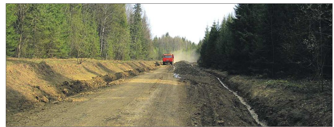
Посёлок Унь — отдалённый, сейчас там проживают 192 человека