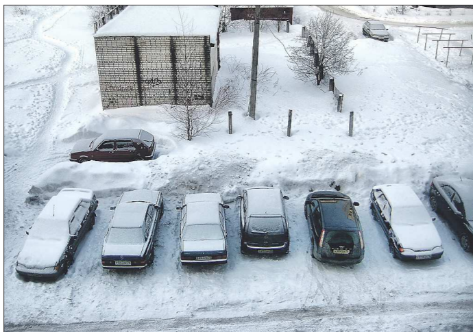
Новые градостроительные нормы могут увеличить скопление автомобилей во дворах Екатеринбурга

Безусловно, радует стремление мэрии столицы Урала четко определить, какие объекты можно возводить в той или иной части города, но бурную дискуссию в гордуме вызвало решение изменить