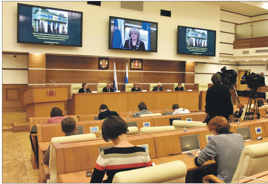
В отличие от прошлого года нынешняя пресс-конференция прошла там же, где депутаты работают — в здании Законодательного собрания

Большое внимание мы уделяли развитию местного самоуправления. На сегодняшний день мы приняли законы, которые позволяют избирать глав муниципальных образований так, как это предусмотрено федеральным законодательством. У нас уже 61 муниципальное образование