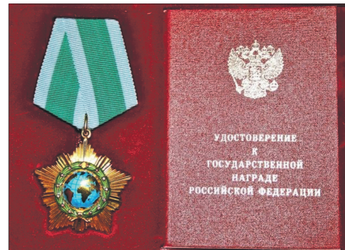
Орден Дружбы был учрежден 2 марта 1994 года. Предшественником этой награды во времена СССР был орден Дружбы народов, учрежденный в 1972 году

Подготовили Мария ИВАНОВСКАЯ, Александр ПОНОМАРЁВ