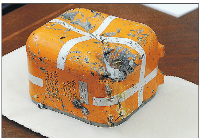
Бортовой самописец со сбитого турками российского военного самолёта министр обороны РФ Сергей Шойгу лично доставил Владимиру Путину ещё 8 декабря

В российском Минобороны заявили, что чёрный ящик Су-24, сбитого турками в Сирии, сильно пострадал: 13 из 16 микросхем энергонезависимой памяти разрушены, три микросхемы повреждены. Это затрудняет расшифровку данных.