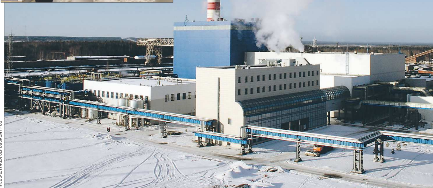
ПРЕСС-СПИЧКА СЕРОВСКОЙ ГРЭС

Владимир Путин принял участие в пуске на Серовской ГРЭС парогазовой установки, позволяющей сократить вредные выбросы в 30 раз