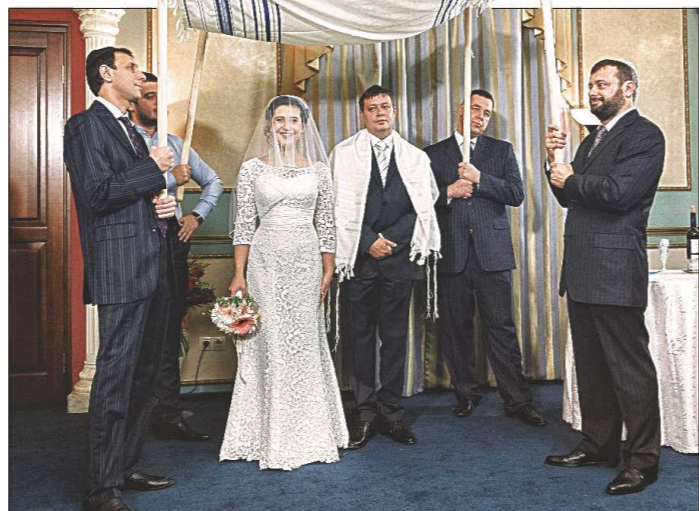
Еврейская свадьба – очень интересный обряд. Мужчины поднимают хупу (балдахин) или талит – покрывало, которым накрываются во время молитвы. Под ним стоят жених с невестой, раввин зачитывает специальный текст, тоже выверенный веками, спрашивает о согласии на брак молодожёнов, всё скрепляется подписями. А потом молодой муж разбивает стакан и растаптывает его на мелкие крошки – это символ того, что Храм наш разрушен, но вера – осталась!

Ингредиенты – филе сельди – 150 граммов, яйца – 2 штуки, яблоко зелёное – 50 граммов, сливочное масло – 70 граммов, лук – 70 граммов, ломтик ржаного хлеба – просто перемалываются в блендере или мясорубке. Отметим, что в каждой еврейской семье есть свой фирменный рецепт этого блюда, неизменны только масло и сельдочка.