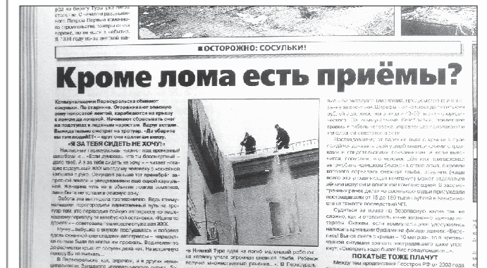
2010 год. Коммунальные службы городов и сёл Свердловской области боролись с сосульками не всегда безопасным способом: «Коммунальщики Первоуральска сбивают сосульки. По старинке. Ограживают опасную зону полосатой лентой, карабкаются на крышу с ломом да лопатой. Начинать сбрасывать снег на подступах к ледяным наростам. Вдруг встали. Выжидательно смотрят на тротуар. «Да уберите вы там людей!» – орут они коллегам внизу»