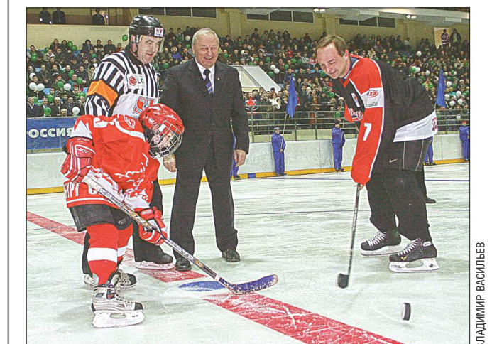
В открытии реконструированного дворца приняли участие тогдашний губернатор области Эдуард Россель (в костюме) и один из самых знаменитых воспитанников свердловского хоккея олимпийский чемпион Илья Бякин (справа)