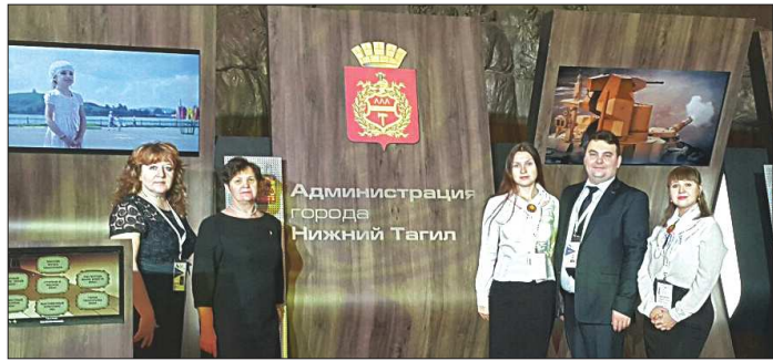
На форуме работает делегация из Нижнего Тагила. Она представляет потенциал развития военно-патриотического туристического кластера в рамках выставки «Территория культуры». На интерактивном стенде УВЗ и администрации города посетители могут ознакомиться с основной информацией о городе и посмотреть на модели тагильского танкопрома