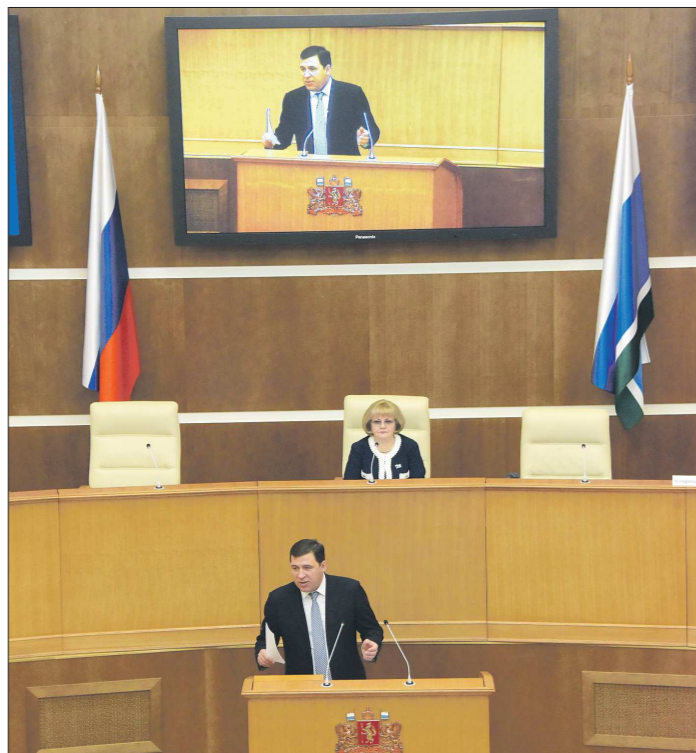
Вчера Евгений Куйвашев выступил перед парламентом в третий раз в этом году: ранее глава региона представлял отчёт о своей работе и бюджетное послание

Более чем на 16 процентов (по сравнению с 2014 годом) вырос объём отгруженной промышленной продукции, составил 1 триллион 403 миллиарда рублей. В этой цифре есть и курсовая разница. Если судить по единице отгруженных товаров, то мы выросли более чем