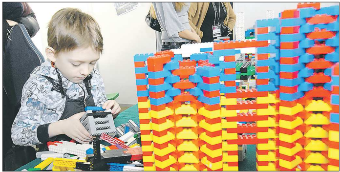
За строительство детских садов муниципалитеты взяли основательно

Хороший пример по темпам строительства — Берёзовский городской округ. Муниципалитет стал одним из немногих, где всего за четыре года создали около трёх тысяч мест в 12 садиках. Финальным стал садик, сданный в начале октября 2015 года. Самый короткий срок, за который был построен детский сад — четыре месяца. Этот садик на 270 мест сдан 4 декабря в Нижнем Тагиле. В ма-