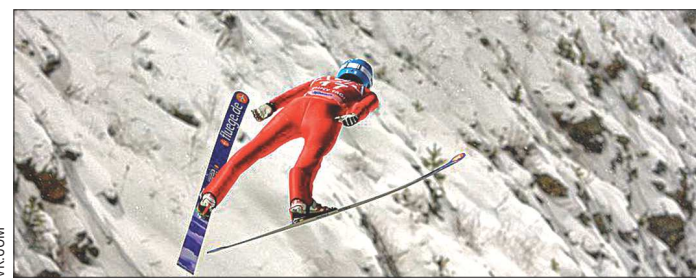
Этап Кубка мира в Нижнем Тагиле стал первым, где соревнования не отменялись и даже не переносились из-за «челюстной» погоды

Но это всё нас ждёт впереди. А пока подведём итоги XIX соревнований на призы «ОГ». Главный результат — на старт в Краснофимске, Новой Ляле, Североуральске и Октябрьском вышли около тысячи человек. И надо сказать большое спасибо муниципалитетам, которые все эти годы поддерживают наше начинание. Очень жаль, что в этом году не было гонок в Екатеринбурге, но будем надеяться, что через год юбилейные XX старты на призы «ОГ» снова пройдут и в областном центре.