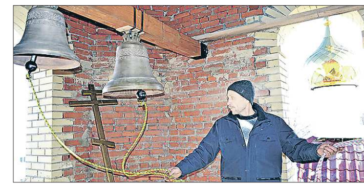
Колокольный звон прозвучал над Городищем впервые за 85 лет