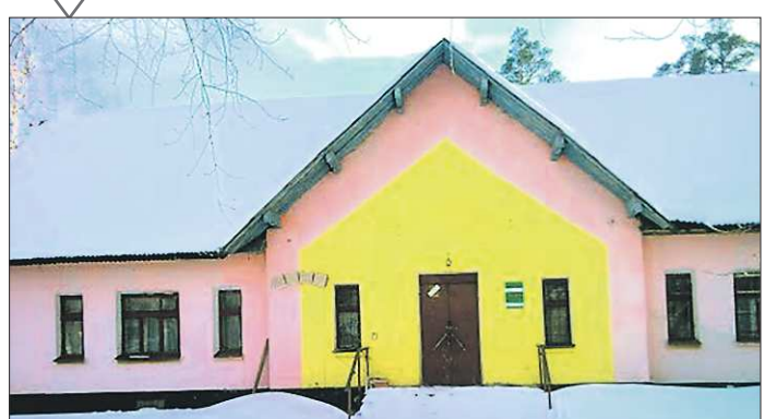
Архитектурные «памятники» верхнепышминской Ольховки: магазин (слева) и жилой дом с резьбой