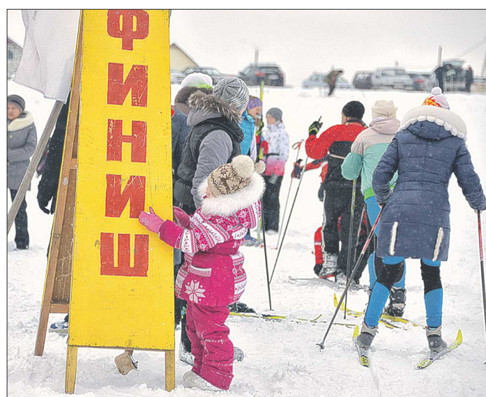
Для кого-то главное просто дойти до финиша...