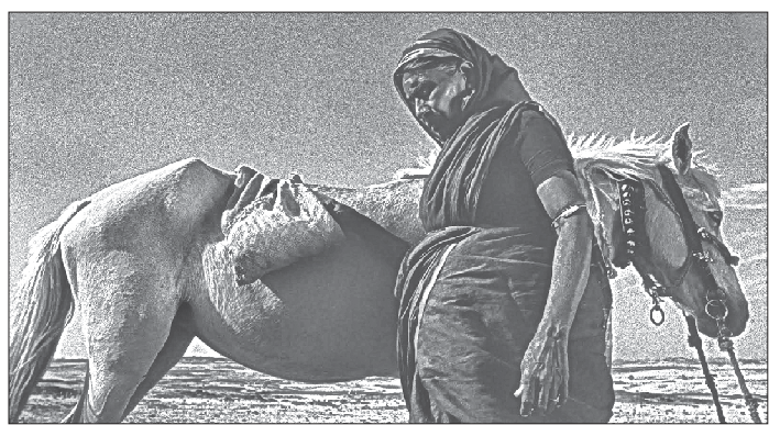
«Камакши» не похожа на типичное индийское кино. Там нет танцев и песен — это новая интерпретация мифологических сюжетов

В этом году экспертное жюри возглавил актёр и режиссёр Сергей Пускепалис . Быть