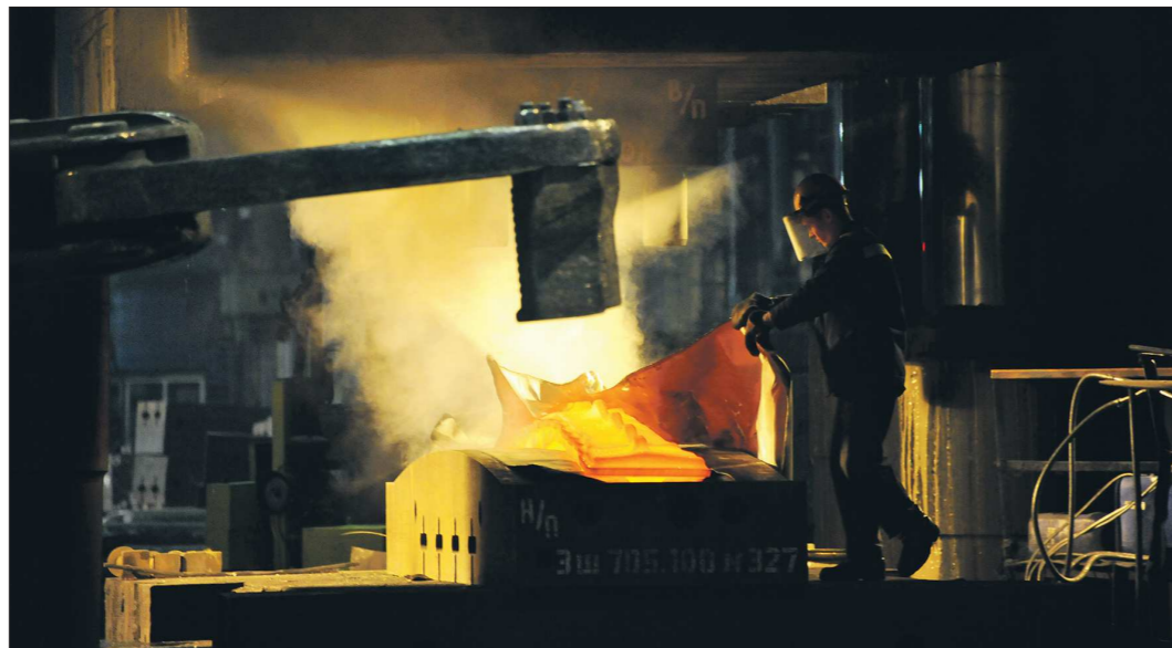
Россия занимает ведущее место в мире по запасам титаносодержащего сырья, но практически не использует его для производства металлического титана из-за трудностей освоения отечественных месторождений

По экспертным оценкам, для модернизации каждой типографии потребуется около 100 миллионов рублей — такая цена оборудования, обеспечивающего полноцветную печать и выпуск газетной продукции. Потенциальных покупателей типографий все собеседники «ОГ» назвать затруднились.