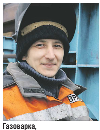
Газоварка, как и авиамоделлирование, — дело почти ноуэлирое