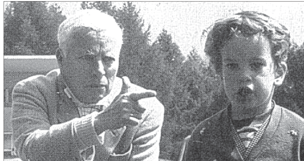
Чарли Чаплин и маленький Юджин разыгрывают репризу. Юджин отметил, что ему нравится абсолютно все работы отца. «Он делал просто невероятные вещи!»