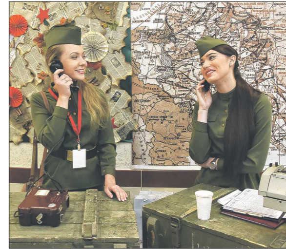
Даже зона регистрации на медиафоруме стилизована под блиндажи и корреспондентские пункты времён Великой Отечественной войны.