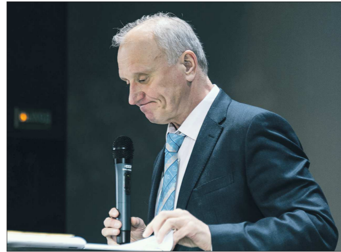
Геннадий Бурбулис, как и Борис Ельцин, — уроженец Свердловской области: он родился в Первоуральске