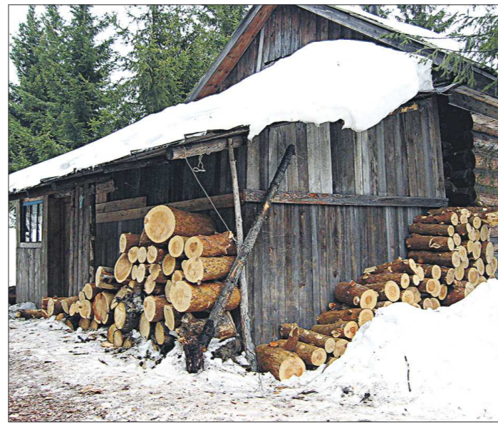
Чтобы обогреть дом без газа зимой, жителям в среднем нужно три тележки дров объёмом около 6 кубов и стоимостью 6 тысяч рублей каждая — существенные расходы для сельских пенсионеров