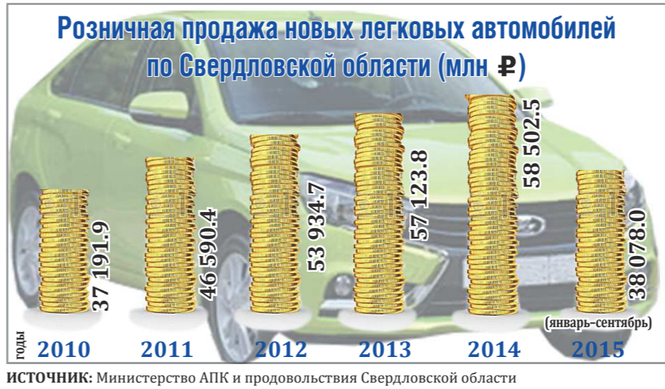
ИСТОЧНИК: Министерство АПК и продовольствия Свердловской области

По мнению аналитиков «Автостата», 2016 год будет не менее трудным для российского автопрома. В итоге часть иномарок перестанет продаваться в России. Пока самый известный такой случай — уход с нашего рынка американского концерна «GM». Сужающийся выбор брендов также заставит продавцов и покупателей присматриваться к отечественным маркам.