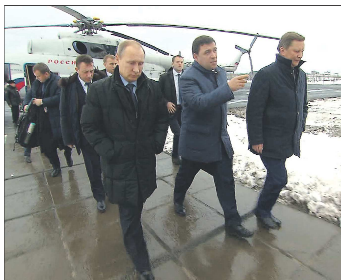
Важнейшие вопросы развития Свердловской области Владимир Путин и Евгений Куйвашев обсудили во время перелёта из Нижнего Тагила в Екатеринбург

Налоги платятся по месту регистрации, и очень хорошо, что Уралвагонзавод пошёл нам навстречу. Необходи-