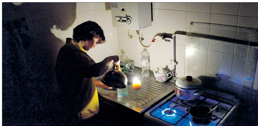
После подрыва опор ЛЭП в Херсонской области крымчанам, как этой жительнице Симферополя, невольно пришлось стать романтиками и готовить при свечах. Полуостров перешёл на автономные источники питания, но они могут обеспечить не более половины нужной мощности

Однако на то, что правоохранительные органы Украины найдут виновных, глава республики не надеется. Напротив, он уверен, что Украина вино-