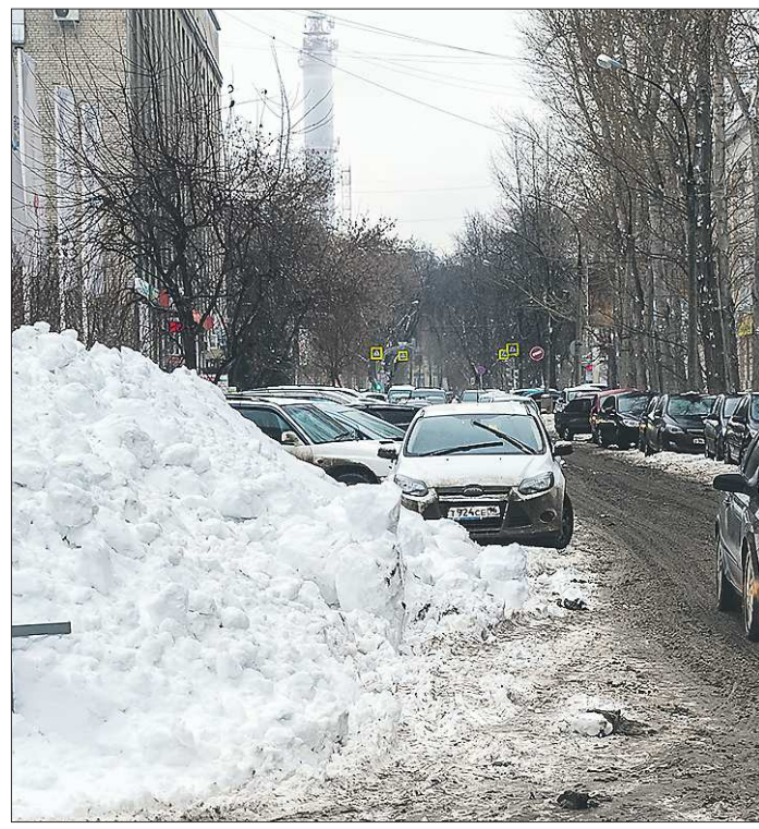
Это мэрия называет «убрали город»

— Ачит для вас родной поселок? — Да, я здесь родился и вырос. Даже когда учился в институте в Свердловске, мыслей уехать насовсем не возникало. Сейчас мои дети первый год учатся в вузе, но решат ли они последовать моему примеру — не знаю. Думаю, что каждый должен сам сделать выбор.