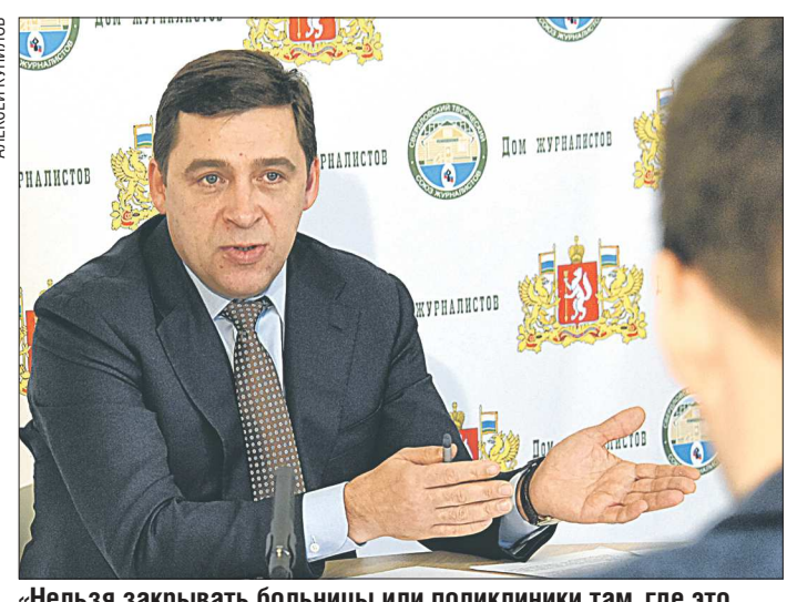
«Нельзя закрывать больницы или поликлиники там, где это может ухудшить качество медпомощи. Но когда койко-место в больнице реально используется десять дней в году, нужно принимать какие-то управленческие решения»