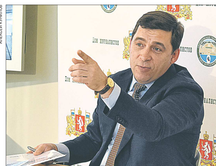
«Человек мне сказал: «Вы тут не рассказываете сказки, а решите проблему с очередями в детские сады». Прошло три года. Проблема решена»