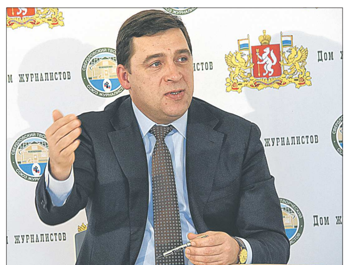
«Свердловская область выполняет все задачи по развитию производственных предприятий. У нас хорошая динамика роста, особенно сильно это заметно в машиностроении»

Записали Татьяна БУРДАКОВА, Александр ПОНОМАРЁВ