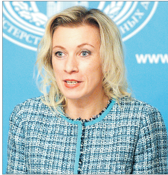
До назначения на нынешнюю должность Мария Захарова получила широкую известность участием в телевизионных политических ток-шоу и яркими комментариями по острым политическим вопросам в социальных сетях. Она является одним из самых цитируемых российских дипломатов

Что касается российской операции, то она стоит на прочной основе международного права. Мы действуем исключительно и только по согласованию с Сирией. Нас попросил об этом официальный Дамаск. Мы координируем свои действия и с Сирией, и с другими странами. И у нас нет никаких сомнений в том, против кого мы воюем. Мы воюем против ИГИЛ и против всех, кто осуществляет схожую террористическую деятельность.